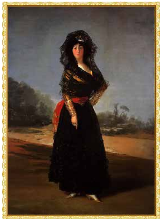
Figura 2. Duquesa de Alba en duelo

Nota. Francisco Goya. Duquesa de Alba , 1797. Imagen de dominio público.