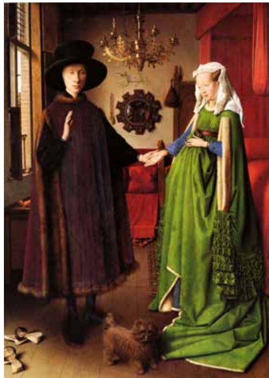
Figura 1. Matrimonio Arnolfini

Nota. Jan Van Eyck. Arnolfini Portrait , 1434. Imagen de dominio público.